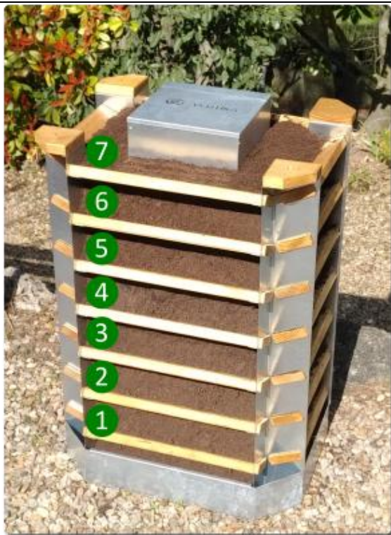
Numérotation des étages de culture